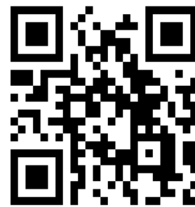
登録用2次元コード